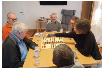
Gemeinsam zu spielen, regt den Geist an und fördert Lebensfreude.

Eine OASE, ein Begegnungszentrum zum Orientieren – Austauschen – Selbstbestimmen – Erleben – eröffnete unsere Mitgliedsorganisation Phoenix dieses Jahr in Freising. Hier können Menschen mit (cerebralen) Einschränkungen zusammenkommen und je nach Fähigkeit miteinander aktiv beziehungsweise unterstützt werden. Für den Verein ein weiterer Schritt, seinem hoffnungsvollen Namen gerecht zu werden. Denn er möchte Erkrankten und ihren Familien ermöglichen, nach Schick-