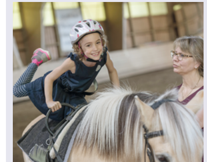
Auf dem Rücken der Pferde liegt das Glück, gerade auch für Menschen mit Behinderung.

Karte mit Suchfunktion kann jetzt auch kostenfrei als App aufs Handy geladen werden: im Apple und im Google Play Store.