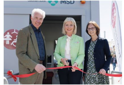
Eröffnung einer mobilen „Toilette für alle“ durch die Bayerische Sozialministerin Ulrike Scharf (Mitte), Beate Bettenhausen (r.) und Reinhold Scharpf (l.)

salsschlägen wie einem Schlaganfall oder einer anderen plötzlichen Hirnschädigung wie „Phoenix aus der Asche zu steigen“ – und ihr neues Leben aktiv zu gestalten.