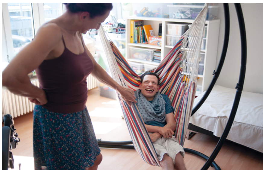
Wie Einrichtung das Wohlbefinden fördern kann, war dieses Jahr Thema der Fachtagung.

Menschen mit schweren und mehrfachen Behinderungen profitieren nur dann von wissenschaftlichen Erkenntnissen und technischen Neuerungen, wenn diese in der Praxis ankommen und im Alltag umsetzbar sind. Um dies zu ermöglichen, gründete unser Verband 2005 die Stiftung Leben pur.