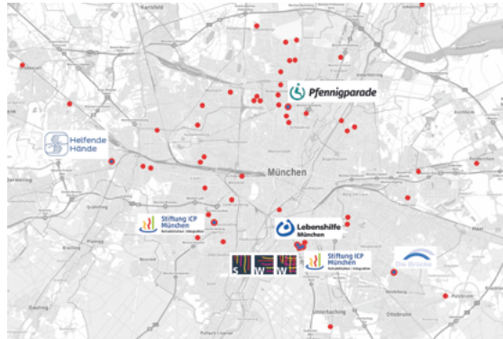
Sieben Träger in München helfen 10.000 Menschen mit komplexer Behinderung nun auch bei der Arztsuche.

Einen Termin bei Hausarzt oder Facharzt zu bekommen, ist oft schwierig. Noch schwieriger ist dies für Menschen mit komplexen Behinderungen. Viele Arztpraxen und Kliniken sind nicht barrierefrei. Viele Ärzte und Therapeutinnen nicht dafür ausgebildet, mit Menschen zu kommunizieren, die nicht oder nur schlecht sprechen können. Und die meisten Menschen mit komplexen Behinderungen können Praxen und Behandlungszentren nicht selbstständig aufsuchen. Damit Patienten, Ärzte und Therapeuten trotzdem zusammenkommen, wurde dieses Jahr ein Koordinierungsbüro eröffnet. Getragen wird das Büro von sieben Organisationen der